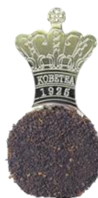
※茶葉イメージ テトラティーバッグ商品です

ミルクティーベースのブレンド紅茶に、メープルの甘い香りをつけたフレーバードティーです。パッケージは、メープルの美しい琥珀色（アンバー）をイメージした色合いに雪の模様や楓（メープル）の模様をあしらいました。あたたかいミルクティーでほっこりとしたティータイムをお楽しみください。